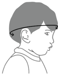
Obvod hlavy dieťaťa

Tip: Ak nemáte krajčírsky meter, zmerajte obvod hlavy akoukoľvek šnúrkou a nameranú dĺžku šnúrky potom zmerajte pevným metrom.